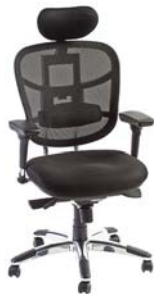
Réf. FMTK01NR Noir