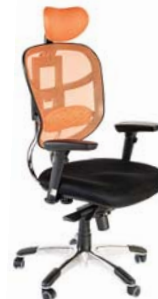
Réf. FMTK01NRRG Noir / Orange