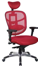
Réf. FMTK01BX Bordeaux