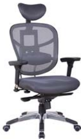
Réf. FMTK01GR Gris